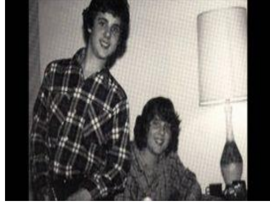
Money'in deney ikizleri

John Money ise cinsiyet ideolojisinin temelini atmıştır. Cinsiyet kimliği ve Cinsiyet rolleri terimleri Money'e aittir. Money'nin en önemli katkısı ise her insanın doğduğunda nötr cinsiyetli olduğunu ve kişilerin cinsiyetlerinin büyümeleri esnasında çevrenin belirlediğini öne sürmesidir. Money, teorisini ispatlamak için ikiz erkek çocuk deneyini gerçekleştirerek birisini erkek diğerini ise kız olarak yetiştireceğini ispatlamaya çalıştı ve ikizlerden birisi tam olarak bir kız gibi yetiştirildi. Bu deney süresince cinsel istismarlar da yaşandı. Deney sonunda kız olarak yetiştirilmeye çalışılan çocuk, kız cinsiyetini benimseyemeyerek tekrar erkek cinsiyetine döndü. Sonuç olarak bu deney ikizlerden her ikisinde de travmalar bırakarak genç yaşta ölüme sürükledi. Kinsey ve Money'nin çalışmaları günümüz toplumsal cinsiyet ideolojisinin temellerini oluşturdu.