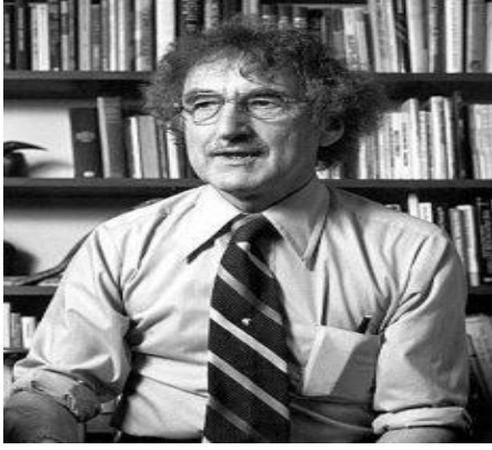
John Money (1921-2006) Psikolog Yazar

İnsanlar/Kişiler doğumdan ölüme kadar seksüel varlıklardır ve yaştan bağımsız olarak kişinin bu varlık amacı doğrultusunda hareket ettiği sürece mutluluğu yakalayabilir. - Alfred Kinsey