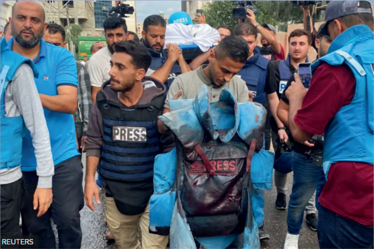
Gazze’de bir gazeteci, 10 Ekim’de öldürülen bir meslektaşının kanlı çelik yeleşini taşıırken